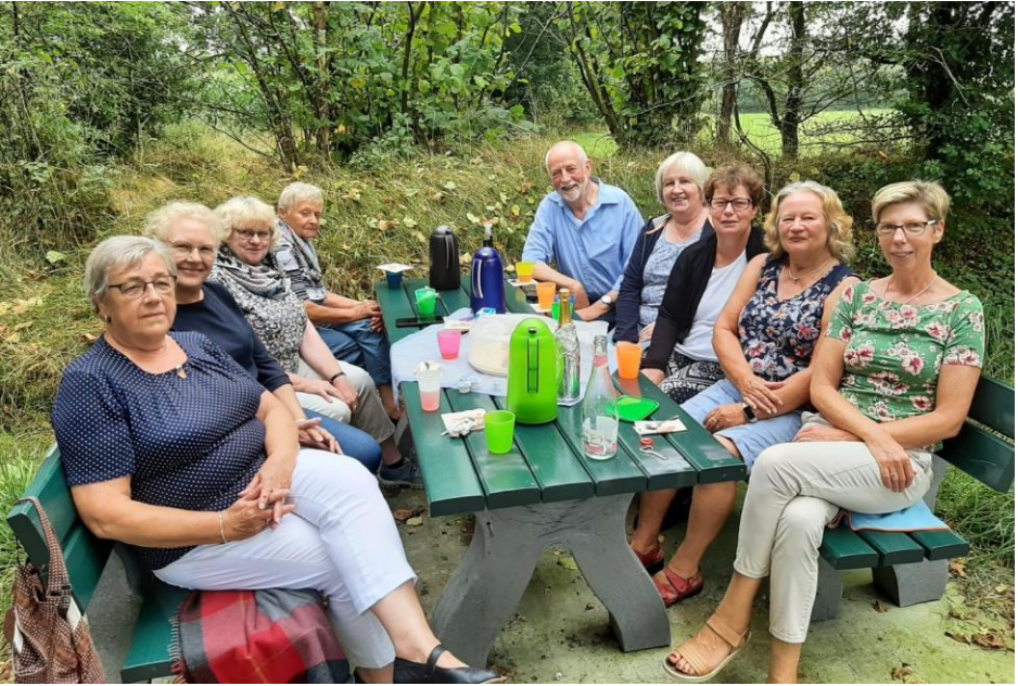
Ein Ausflug des Besuchsdienstkreises im August – vielen Dank an dieser Stelle für all euer Besuchen und Begleiten.