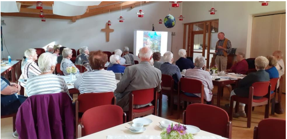
Im September war das erste Treffen des neuen Seniorenkreises – Tee, Kuchen, Lieder und ein Bild - ein schöner Nachmittag – Weitere Gäste sind herzlich willkommen – immer am 2.Dienstag im Monat .