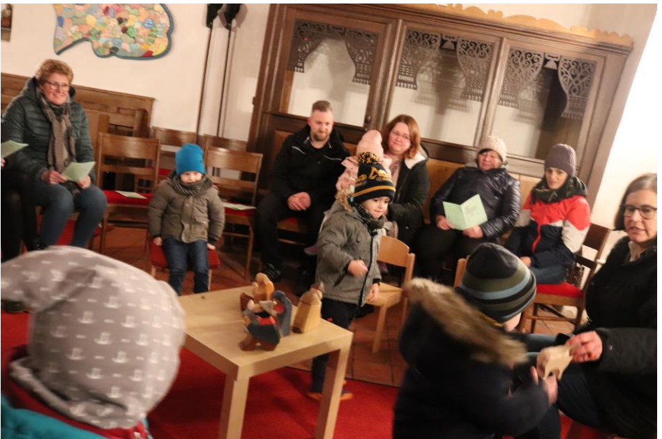
Andacht in der Kirche