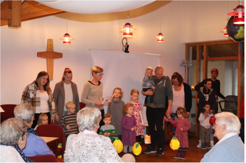
Besuch beim Seniorenkreis