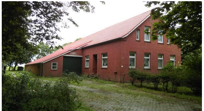
Dach nach der Sanierung

Der Kirchenvorstand lädt alle Interessierten zu einer Besichtigung am 12. Oktober 2019 von 10.00 Uhr bis 13.00 Uhr ein.