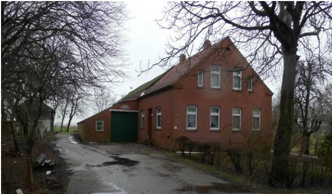
Dach vor der Sanierung

Die dringend notwendigen Dachsanierungsmaßnahmen zur Erhaltung der Bausubstanz des geerbten Hofes Hemmen sind mittlerweile abgeschlossen.