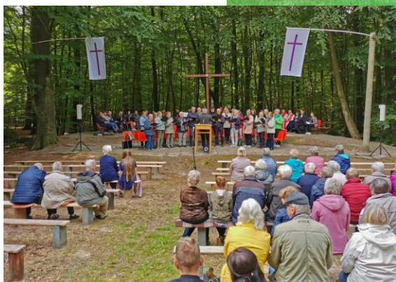
Pfingstgottesdienst im Ihlower Klosterwald mit allen Pastor*innen der Region und dem Gemischten Chor Bangstede- Westerende