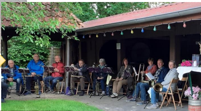
Himmelfahrt im Fahnster Krug mit Posaunenchor

Auf den folgenden Seiten finden Sie einige Bilder zum Geschehen der letzten Zeit.