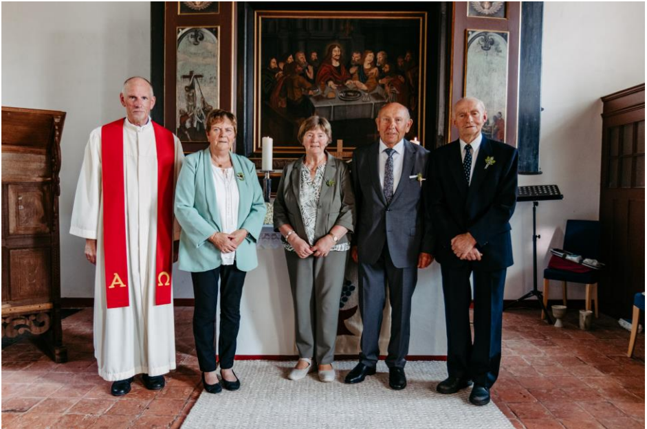
Diamantene-, Gnaden- und Kronjuwelenkonfirmation