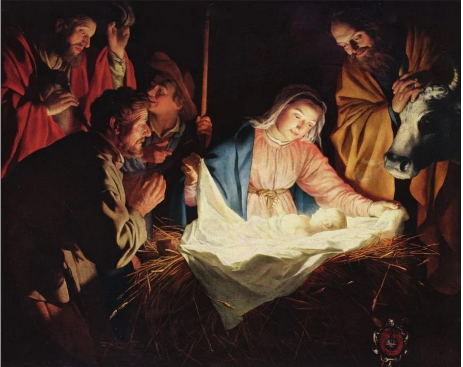
Gerhard van Honthorst, Anbetung der Hirten 1622

Dieses Bild zeigt eine meiner liebsten Weihnachtsszenen. Die klare Zeichnung der Personen, die Freude auf den Gesichtern in so vielen Schattierungen, von der stillen Einkehr des vorderen Hirten, bis zur Heiterkeit des jungen Mannes neben Maria – allein das macht dies Bild sehenswert. Doch noch etwas anderes ist es, was hier auffällt – es ist die stille Übereinkunft: Heute passiert nichts. Nicht in diesem Stall, nicht in dieser Nacht. Heute ist Frieden – der Ochse wird seinen Kopf nicht wegziehen, wenn Josef sich auf ihn stützt und die Konflikte der Generationen, der erfahrenen alten Hirten und des ungestümen Jungen schweigen – das Einzige, was zählt, ist diese tiefe Gelassenheit, die spürbare Herzensfreude und Ruhe dieser Nacht.