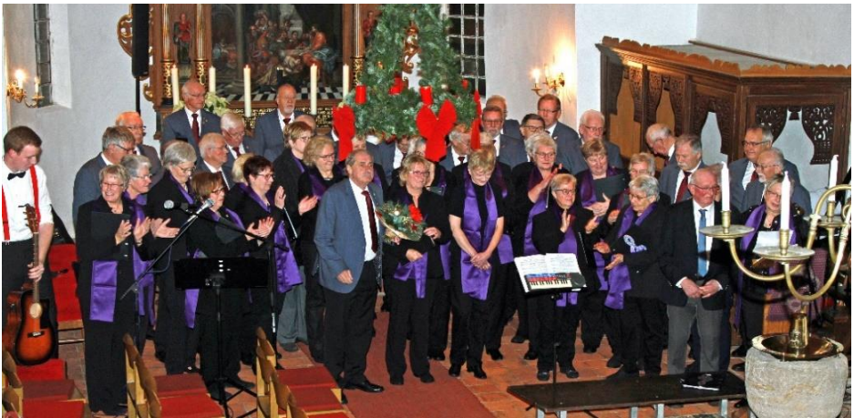
Adventskonzert 2018 mit dem MGV in unserer Kirche