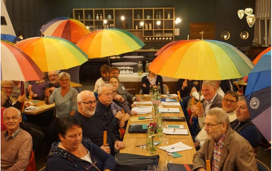
Foto von „beschirmt“ Kirchenkreistagsmitgliedern