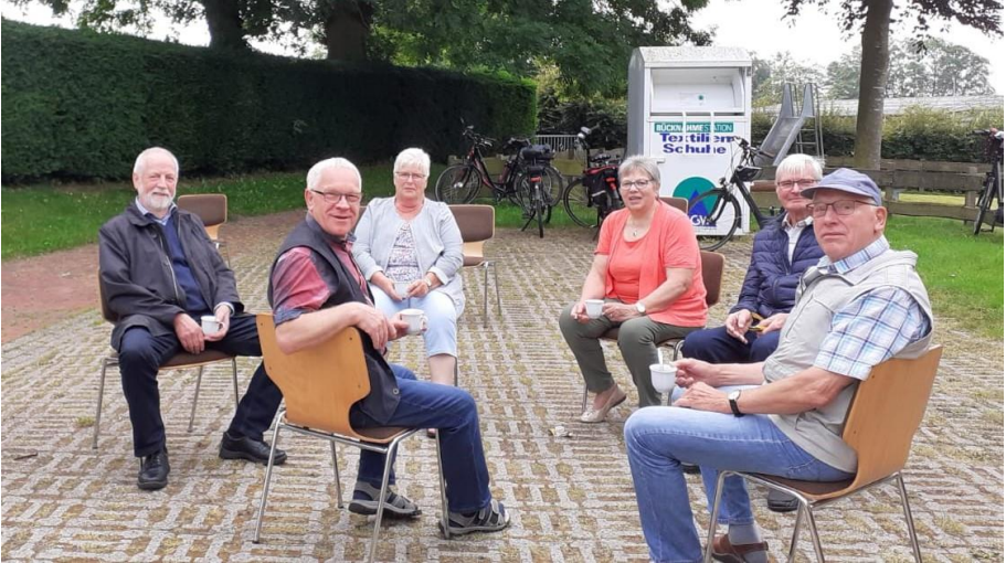
Muntere Runde in Bangstede nach dem Gottesdienst

Seit dem 17. Mai dürfen wir wieder Gottesdienste feiern. In den Kirchen ist die Teilnehmerzahl begrenzt durch die Abstandsregeln. Da der Sommer sehr schön war, sind wir, so oft es ging mit unseren Gottesdiensten draußen gewesen. Wie das diesen Sommer war, können sie auf den folgenden Bildern sehen: