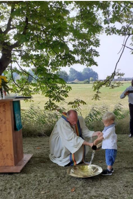
Hilfe bei der Taufe