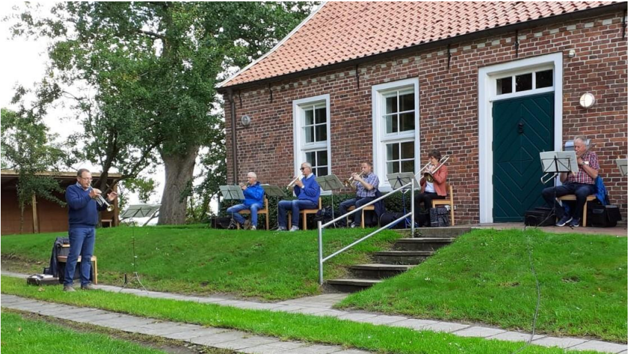
Mit Posaunenchor in Barstede