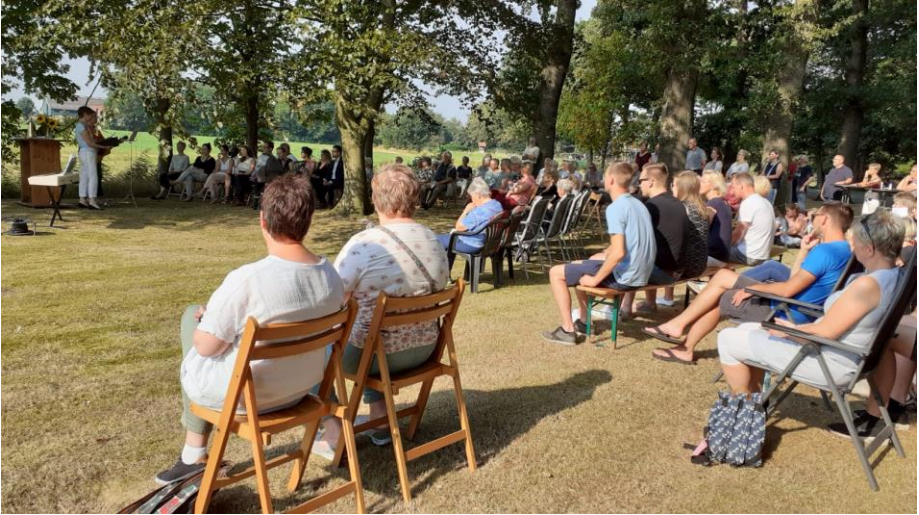
Wenn Menschen in Gruppen kommen, können mehr Leute teilnehmen. Gottesdienst im LütjeHolt